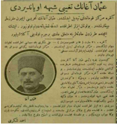
Vatan, 1 Nisan 1339