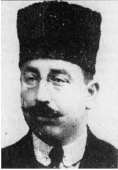
Ali Şükrü Bey