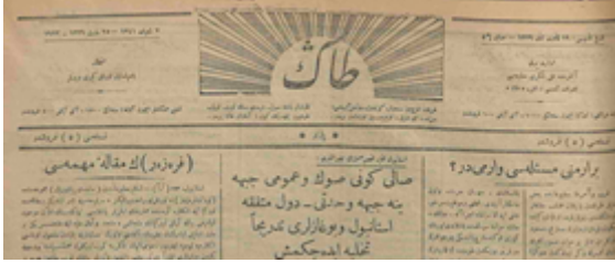
Tan, 25 Mart 1339