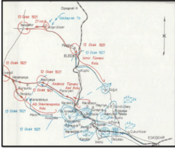
Birinci İnönü Muharebesi Askerî Harekâtı 12-13 Ocak 1921 Kaynak: Türk İstiklal Harbi Batı Cephesi , Cilt 2, Kısım 3, Genelkurmay Başkanlığı Harp Tarihi Dairesi Resmi Yayını, Ankara 1966.