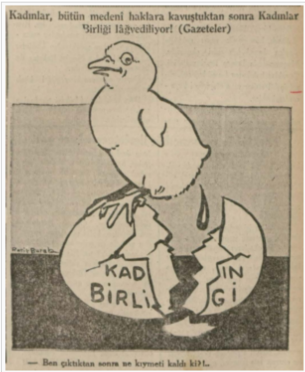
28 Nisan 1935, Cumhuriyet