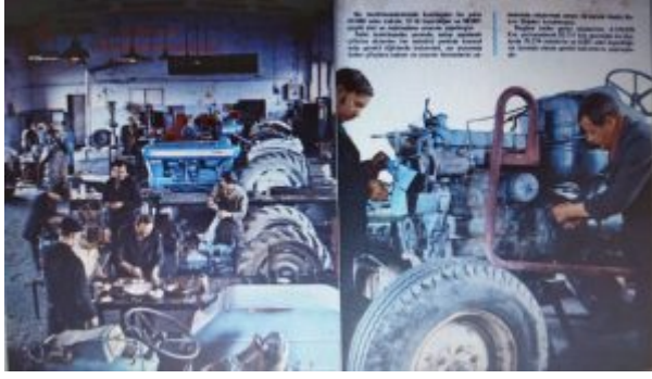
Ekler Kaynak: Cumhuriyetin 50. Yılında Türkiye Ziraî Donatım Kurumu, Haz. Ali Tarhan., vd. Ziraî Donatım Kurumu, Ankara, 1973.