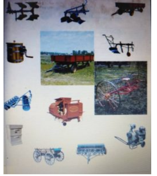
Ekler Kaynak: Cumhuriyetin 50. Yılında Türkiye Ziraî Donatım Kurumu, Haz. Ali Tarhan., vd. Ziraî Donatım Kurumu, Ankara, 1973.

28/11/2023 tarihinde https://ataturkansiklopedisi.gov.tr/bilgi/turkiye-zirai-donatim-kurumu-1943-1998/?pdf=5507 adresinden erişilmiştir