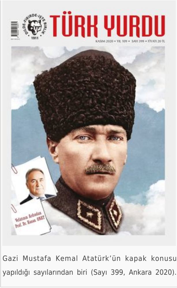
Gazi Mustafa Kemal Atatürk'ün kapak konusu yapıldığı sayılarından biri (Sayı 399, Ankara 2020).