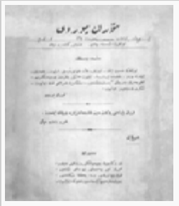
Derginin ilk sayısının dış kapağı [24 Teşrin-i sanî 1327 (7 Aralık 1911)]