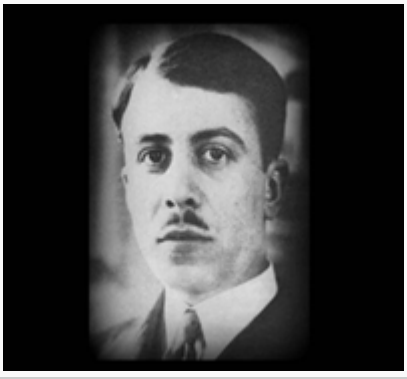
HASAN FERİT ALNAR