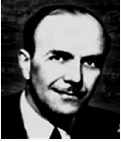
CEMAL REŞİT REY