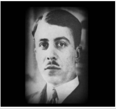
HASAN FERİT ALNAR