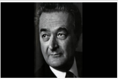
AHMET ADNAN SAYGUN