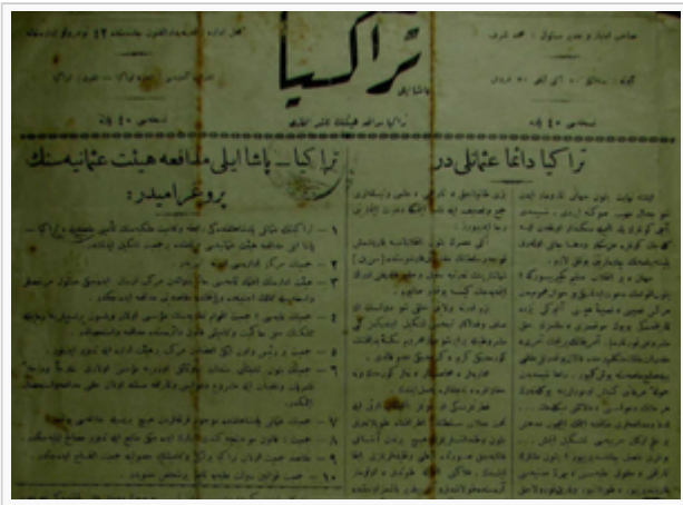
Trakya Paşaeli Gazetesinin İlk Sayısı ve Cemiyetin Programı

Gazetede yayınlanan haber ve makale içerikleri incelediğinde kamuoyuna bölgesel bir aidiyet fikri sunduğu, toplumu bu fikre inandırmaya ve dâhil etmeye çalıştığı anlaşılmaktadır. Bu doğrultuda kamuoyunu güncel haberler ile bilgilendirmekten ziyade toplumun "düşman" karşısında motivasyon kazanabilmesine yönelik yayınlar gerçekleştirmiştir. Bu yayın politikası didaktik ve tek taraflı bir şekilde sürdürülmemiş gazetenin ilk sayısından itibaren kolektif bir yayıncılık anlayışı takip edilmiştir. Bu doğrultuda başta bölge aydınları olmak üzere tüm Doğu ve Batı Trakya halkına çağrıda bulunulmuş, şayet ellerinde "bizi tanıyacak, tarihi ve ilmî vesikalar" ise bunları gazeteye göndermeleri istenmiştir.