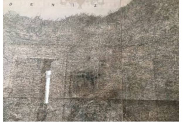
Dersim isyanı sırasında Atatürk tarafından harita üzerinde yapılan işaretlemeler: Trabzon Atatürk Köşkü'nde 27 Temmuz 2021 tarihli inceleme

Bugün müze olarak hizmet veren ve Trabzon'un en fazla ziyaret edilen yerlerden birisi olan Köşk'te, 19. yy sonu ile 20. yy ait mobilyalar, porselenler, halılar vb. başka Atatürk'e ait eşyalar ile tablolardan oluşan 344 adet eser sergilenmektedir. Köşk'ün girişinde sağda Atatürk'ün Trabzon'a ilk gelişinde yaptığı konuşmanın tam metni asılıdır. Yine odalara geçit veren salon duvarlarında Atatürk'ün gezilerine ait fotoğraflar bulunmaktadır. Atatürk'ün dinlendiği koltuk ve kanepeler, yemek salonu, üçüncü katta Atatürk'ün yatak odası, banyosu, yaver odaları ve çalışma salonu vardır. Ayrıca Atatürk'ün Dersim isyanı sırasında harekât planını ve üzerinde bizzat işaretlemeler yaptığı bir harita ziyaretçilere açık vaziyettedir.