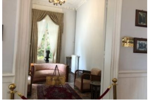
Vasiyet odası: Trabzon Atatürk Köşkü'nde 27 Temmuz 2021 tarihli inceleme