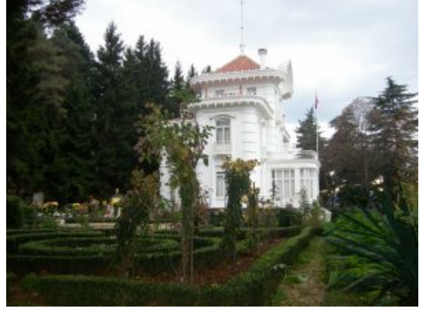
Trabzon Atatürk Köşkü

Zarif dekoratif süslemelerin ön plana çıktığı Art Nouveau mimarisinin etkilerini taşıyan ve bodrumu ile birlikte dört katlı olan Köşk; taş, tuğla ve ahşap yapı malzemesi kullanılarak, yığma yapım tekniğiyle, konut olarak kullanılmak üzere yapılmış bir bina olup girişi doğudandır. Köşk'ün dış cephesinde taş, iç cephesinde Bağdadî tekniği (ahşap çıtaların, 2 - 3 cm aralıklı olarak, ahşap iskeletin iç ve dış yüzeyine çakılması) ve zeminde ise karo mozaik kullanılmıştır. Mozaik döşemeleri, ampir alçı süslemeleri, üst katlara çıkan geniş ve süslü ahşap döner merdivenleri ile kuzey yönünden bahçeye inen eğrisel merdivenleri binanın başlıca mimari özellikleri olarak dikkati çekmektedir. Köşk'ün bodrum katında hizmet alanları ve hamam, giriş katında oturma, dinlenme, yemek ve misafir odaları ile mutfak, banyo, birinci katta çalışma, bekleme, toplantı ve yatak odaları yer almaktadır. İkinci katta ayrıca iki küçük oda daha bulunmaktadır. Köşk'te göze çarpan bir diğer özellik ise dönemin ileri teknolojisi ile yapılan su ve ısıtma tesisatıdır.