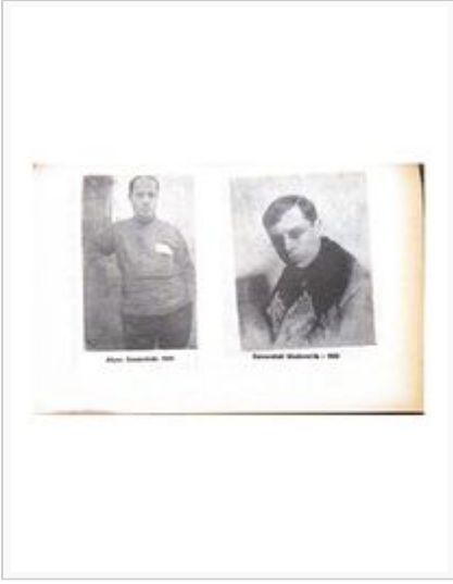
Şevket Süreyya 1920'ler