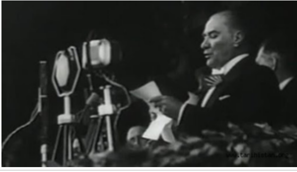
Gazi Mustafa Kemal Onuncu Yıl Nutku'nu okurken(Ankara-hipodrom-29 Ekim 1933)