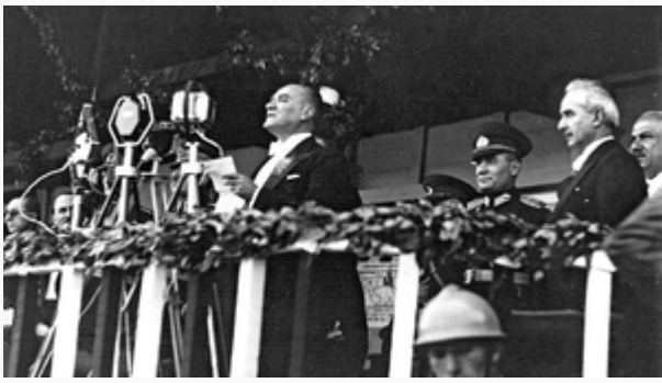
Gazi Mustafa Kemal Onuncu Yıl Nutku'nu okurken(Ankara-hipodrom-29 Ekim 1933) 2