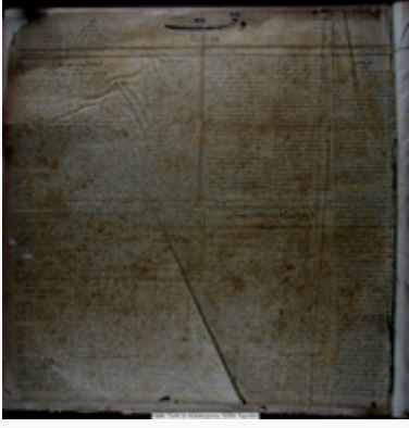
(22 Ekim 1917 tarihli Vakıf gazetesinin ilk nüshası)