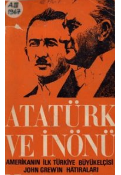
Amerika'nın İlk Türkiye büyükelçisi John Grew'in Hatıraları

http://www.nuclearfiles.org/menu/library/biographies/bio_grew-joseph.htm