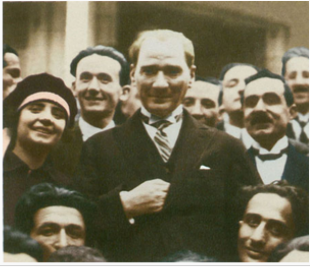
Bursa'da İstanbul Belediye Konservatuvarı topluluğunun verdiği konserden sonra çektiği resim 29 Mayıs 1926