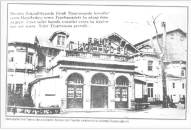
İstanbul Belediyesi Şehir Tiyatrosu Tepebaşı Binası