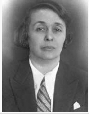
Görsel1: Huriye Öviz Baha