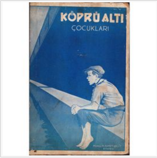
Görsel 2: TBMM Kütüphanesi