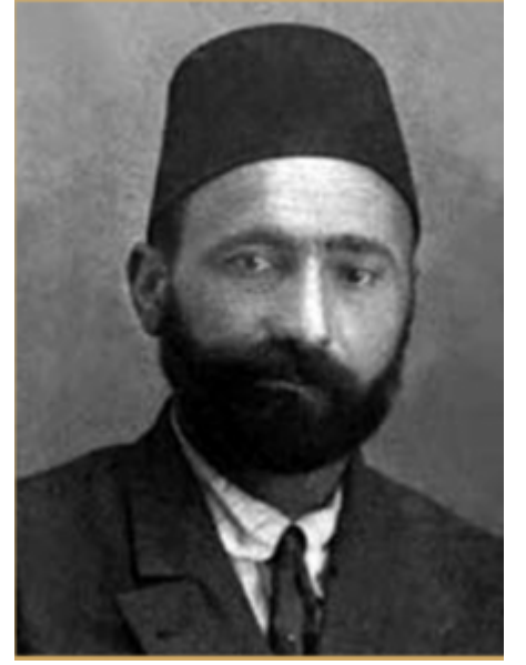
Hamdi Bey (Yılmaz)

Birinci Dönem TBMM'nin Genç Sancağı milletvekillerinden olan Hamdi Bey, 1879'da Hafız Mehmet Efendi'nin oğlu olarak Siirt'te dünyaya gelmiştir. İlk ve orta öğretimini rüştiyede tamamladıktan sonra memuriyete başlamıştır. Memuriyet hayatı boyunca bölgesindeki sancak ve ilçelerde adalet hizmetlerine ilişkin birçok pozisyonda zabıt kâtipi, başkâtip, icra memuru ve noter olarak görev yapmıştır. Hamdi Bey'in, bazı kaynaklarda, Genç'in Şer'îye Mahkemesi Başkâtipi vazifesini yürütmekteyken Erzurum Kongresi'ne delege olarak katıldığına ilişkin bilgilere yer verilmiş ise de kongre delegelerinin isimlerinin yer aldığı temel kaynaklarda ismine rastlanmamıştır. Erzurum Kongresi'nde yer alan ve görüşmeleri bizzat takip eden Mazhar Müfit Bey'in Erzurum Kongresi delege listesi incelendiğinde, ne o zamanki idari taksimat gereği Genç'in bağlı olduğu Bitlis ne de kongreye delege gönderen diğer vilayetlerin delegeleri arasında Hamdi Bey'in isminin yer almadığı anlaşılmaktadır.