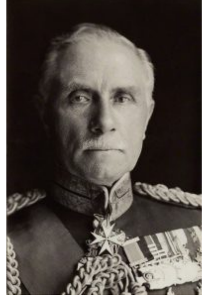
General Milne

Birinci Dünya Savaşı'ndan sonra Boğazlar'dan itibaren Hazar Denizi'ne kadarki tüm İngiliz birliklerinin komutasına getirilmiştir. Ayrıca Mondros Mütarekesi'nin hükümlerinin Türkiye'ye dayatılması göreviyle Trans Kafkasya'da asayişin sağlanması görevleri de kendisine verilmiştir. Bu görevi üstlendiği esnada İzmir'in Yunanlılar tarafından işgal edilmesine “Türklerin ayaklanacağı” gerekçesiyle karşı çıkmıştır. Ayrıca Osmanlı ordularının Mondros Mütarekesi