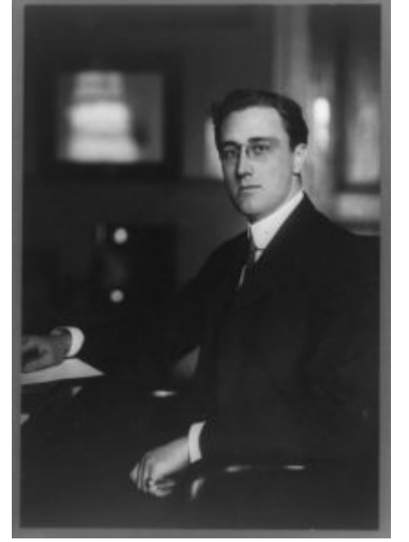
Franklin Delano Roosevelt, 1913 yılında Amerikan Donanma Bakanlığı Müsteşarlığı görevine yeni başladığı sırada çekilen bir fotoğraf.

New York Eyalet Senatosu'nda kendisine yer edinen Roosevelt, 1912 Başkanlık Seçimlerinde teamüllere aykırı olarak üçüncü kere aday olan kuzeni Theodore Roosevelt yerine Demokrat Partili Woodrow Wilson'u desteklediğinden ailesiyle arası açılmıştır. Woodrow Wilson'un desteğini alan Franklin Roosevelt, New York Eyalet Senatosu seçimlerini ikinci kez kazanmıştır. Başkan Wilson göreve başladığında ise Roosevelt'e siyasi desteğinin karşılığı olarak ABD