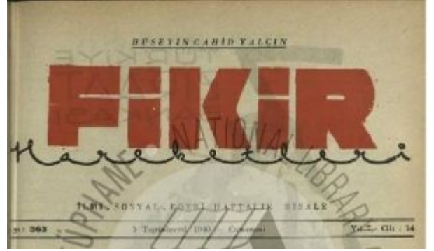
Fikir Hareketleri Kapağı

“Fikir Hareketleri” adlı “ilmi, içtimai, edebi” haftalık dergi (risale),Cumhuriyet’in ilanının onuncu yıldönümünde (29 Teşrinievvel 1933) gazeteci ve siyasetçi Hüseyin Cahit’in(Yalçın) (1875-1957) başyazarlığında ilk sayısı ile okur karşısına çıkmış, çoğunlukla 16 sayfa olarak, yedi yıl boyunca ve 364 sayı yayımlanmıştır. Derginin başmuharriri, muharriri ve hatta “her şeyi” Hüseyin Cahit idi.