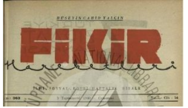
Fikir Hareketleri Kapağı

“Fikir Hareketleri” adlı “ilmi, içtimai, edebi” haftalık dergi (risale),Cumhuriyet’in ilanının onuncu yıldönümünde (29 Teşrinievvel 1933) gazeteci ve siyasetçi Hüseyin Cahit’in(Yalçın) (1875-1957) başyazarlığında ilk sayısı ile okur karşısına çıkmış, çoğunlukla 16 sayfa olarak, yedi yıl boyunca ve 364 sayı yayımlanmıştır. Derginin başmuharriri, muharriri ve hatta “her şeyi” Hüseyin Cahit idi.