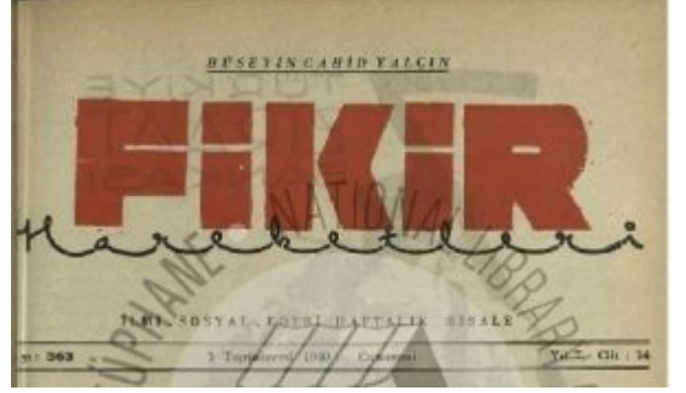
Fikir Hareketleri Kapağı

“Fikir Hareketleri” adlı “ilmi, içtimai, edebi” haftalık dergi (risale),Cumhuriyet’in ilanının onuncu yıldönümünde (29 Teşrinievvel 1933) gazeteci ve siyasetçi Hüseyin Cahit’in(Yalçın) (1875-1957) başyazarlığında ilk sayısı ile okur karşısına çıkmış, çoğunlukla 16 sayfa olarak, yedi yıl boyunca ve 364 sayı yayımlanmıştır. Derginin başmuharriri, muharriri ve hatta “her şeyi” Hüseyin Cahit idi.