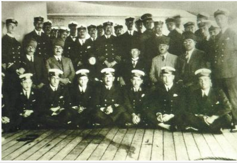
Ulu Önder ATATÜRK, Hamidiye Kruvazörü’nde

Körfezi seçilmiştir. 1923 yılında “Marmara Üssü Bahri ve Kocaeli Müstahkem Mevki Kumandanlığı” adı altında yeni bir komutanlık İzmit’te teşkil edilmiştir. Cumhuriyet Donanmasının denize çıkan ilk büyük harp gemisi Hamidiye Kruvazörü olmuş, 1924 yılında altı ay süreli seyir ile Akdeniz, Marmara ve Karadeniz’deki limanları ziyaret etmiştir. Bu ziyaretler kapsamında Cumhurbaşkanı Gazi Mustafa Kemal Atatürk, 11-21 Eylül 1924 tarihleri arasındaki Karadeniz seyahatini okul gemisi olarak kullanılan Hamidiye kruvazörü ile yapmıştır. Atatürk, bu gezisinde deniz meselelerini daha yakından inceleme fırsatını bulmuştur. 20 Eylül 1924 günü, geminin hatıra defterine yazdığı şu satırlar Deniz Kuvvetlerinin gelişiminde ve güçlenmesinde temel esas olmuştur: “Hudutlarının büyük ve mühim bir kısmı deniz olan Türk devletinin donanması da büyük ve mühim olmak gerektir. O zaman Türkiye Cumhuriyeti daha müsterih ve emin olacaktır. Mükemmel ve güçlü bir Türk Donanması’na malik olmak gayedir. Bunun için azimet noktası harp gemisi tedarikinden önce onları başarı ile sevk-i idareye muktedir komutanlara, subaylara ve uzmanlara sahip olmaktır.”