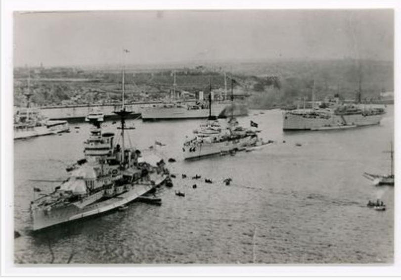
Türk Donanması'nın Akdeniz'de varlık göstermek amacıyla yaptığı Malta ziyareti (Malta, Kasım 1936)

münasebetiyle Varna'ya, 1936 yılında ise beş muhrip, dört denizaltı ve bir denizaltı ana gemisi ile eğitimler yapmak ve Akdeniz'de varlık göstermek maksadıyla Malta ve Yunanistan'a ziyaretlerde bulunmuştur.