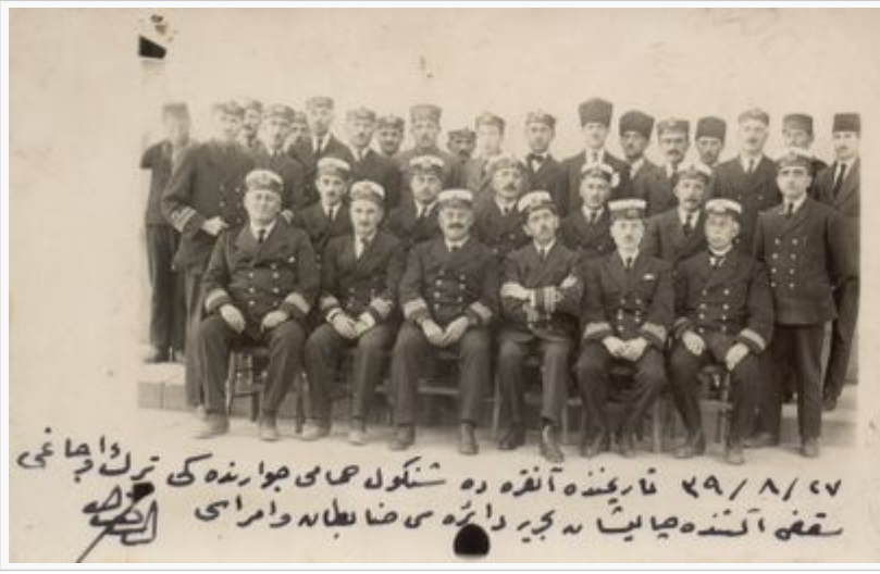
Bahriye Dairesi Reisliği Subayları ve Personelinin Toplu Hatıra Fotoğrafı (Ankara, 27 Ağustos 1923)