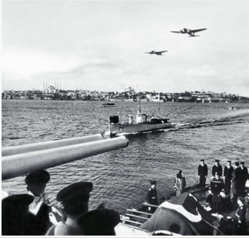
Türk Donanması Ulu Önder Atatürk'e son görevini icra ederken

Türkiye Cumhuriyeti'nin kuvvetli bir donanmaya sahip olması gereğine inanmış ve denize ait konulara ağırlık verip, deniz kuvvetinin diplomasi alanında oynadığı büyük rolün farkına varmıştır.