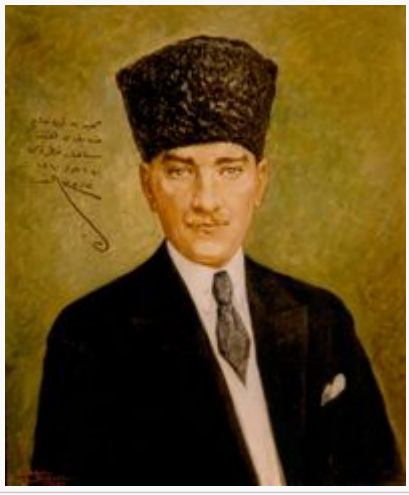
Atatürk'ün Hamidiye Kruvazörü'ne Hediye Ettiği İmzalı Fotoğrafi