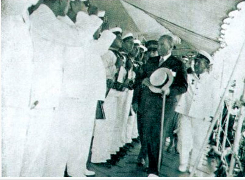
Atatürk'ün Adatepe Muhribi'nde Törenle Karşılması (27 Temmuz 1933)

bakımından sizlere, dış politika bakımından da bizlere büyük hizmetler görecek, gurur sağlayacaktır” diyerek, etkili bir donanmanın o ülkenin dış politikasındaki yaptırım gücüne olan etkisini ifade etmiştir. Nitekim Yavuz muharebe kruvazörü, 1930 yılında onarımın tamamlanmasından sonra Deniz Kuvvetlerinin sancak gemisi olarak, hizmet dışına çıkarıldığı 1950 yılına kadar Türkiye Cumhuriyeti'nin denizlerdeki gücünün bir simgesi olmuş; birçok devlet büyüğü ve yabancı konuk bu gemide ağırlandı.