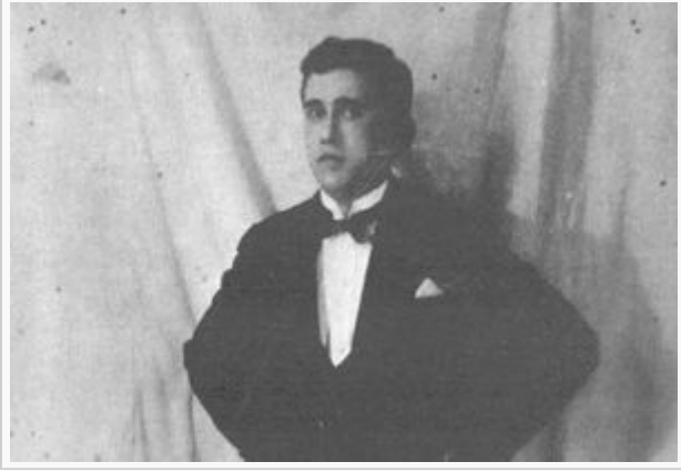
Atatürk'ün Hizmetine Girdiği Günlerde