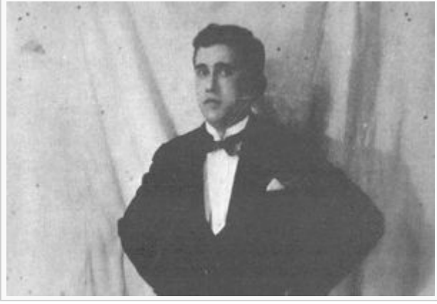
Atatürk'ün Hizmetine Girdiği Günlerde