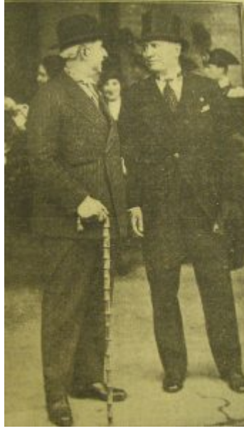
Benito Mussolini-İsmet İnönü, Roma, 25 Mayıs 1932 (La Tribuna, 26 Mayıs 1932)