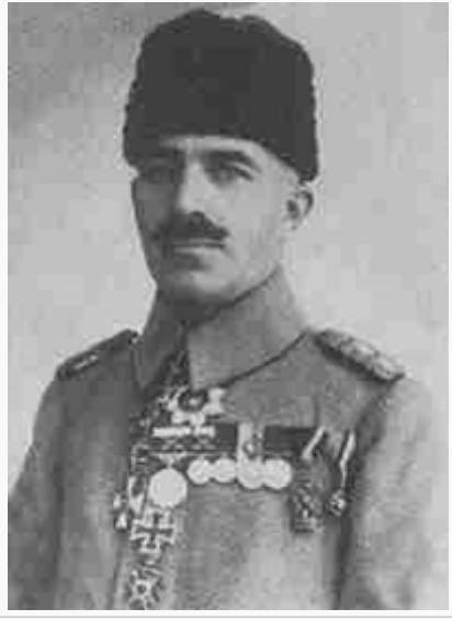
Behiç Erkin üniformasıyla

Ulusal demir yollarımızın kurucusu, değerli devlet adamı ve Atatürk'ün yakın çalışma arkadaşlarından Behiç Erkin Bey 5 Nisan 1876'da İstanbul'da doğdu. Babası Cemil Bey, büyük babası Mareşal Ömer Fevzi Paşa'dır. Babası annesinden küçük yaşta iken ayrılmış, kendisini halası ve eniştesi Basra Valisi Hidayet Paşa büyütmiştir. Çocukluğunda tifo olmuş ve hafif bir çocuk felci geçirmiştir. Eğitimini Bağdat, Erzincan ve İstanbul'da yaptı. 1898'de Harp Okulu'ndan mezun oldu ve kurmay sınıfına ayrıldı. Hızla terfi ederek ülkenin çeşitli yerlerinde görev yaptı ve başarılarından dolayı pek çok madalya aldı. Mustafa Kemal ile 1907'de Selanik'te tanıştı. Bir arada iken sık sık görüşmüşler, değişik yerlerde görev yaptıkları süre içinde de haberleşmişlerdi. 1909'da Selanik İltisak Hattı Askeri Komiserliğine getirildi. Görevi sırasında yaptığı incelemeleri "Demiryolunun Askerî Açından Tarihi Kullanımı ve Örgütü" adıyla kitaplaştırdı. Balkan Savaşı sonunda esir düşen Behiç Bey, yapılan anlaşma uyarınca 1913'te İstanbul'a döndü. Aynı yıl Genelkurmay 3. Şube Şimendifer Kısım Amirliğine atandı. Binbaşı rütbesinde çeşitli görevlerde bulunduktan sonra 1914'te kaymakamlığa (yarbaylığa) yükseldi. 1915'te Ordu Dairesi Başkan Yardımcılığına getirildi. Ordu Dairesi İkmal Şube Müdür Muavini