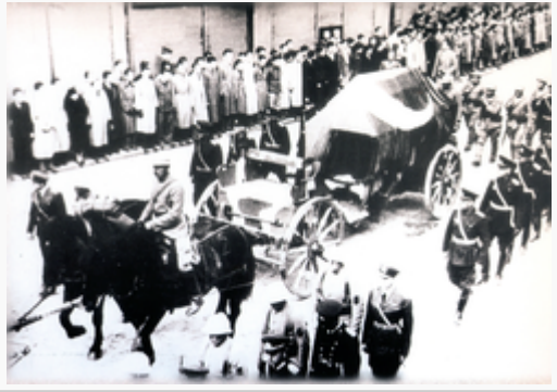
Nakil Töreni 19 Kasım 1938 İstanbul