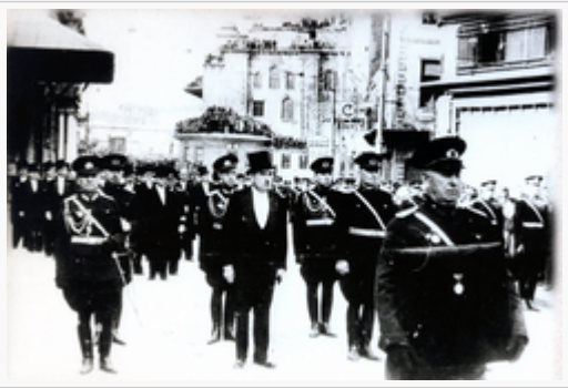
Nakil Töreni 19 Kasım 1938