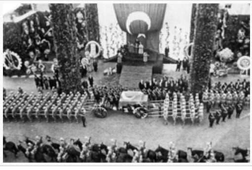
Devlet Töreni 21 Kasım 1938 Ankara