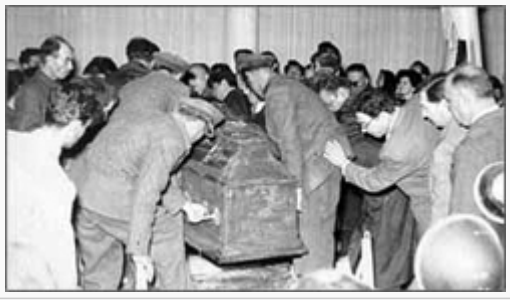
Tabut Çıkarılıyor (4 Kasım 1953- Etnografya) (II)