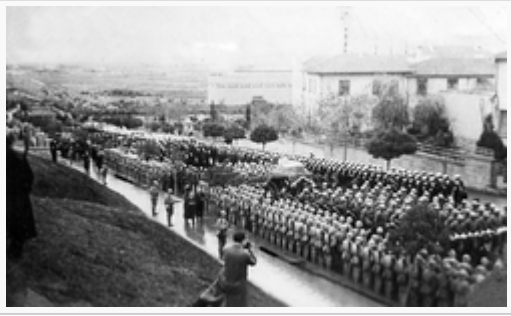
Devlet Töreni (II) 21 Kasım 1938 Ankara