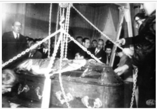
Tabut Çıkarılıyor (4 Kasım 1953- Etnografya)