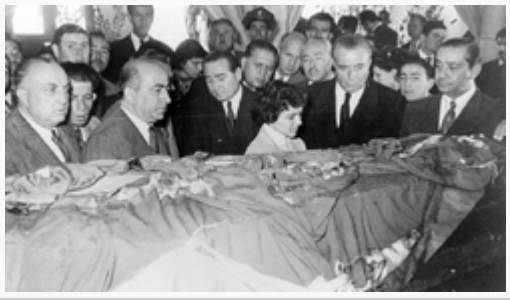
Başbakan Adnan Menderes Tabutun Başında (4 Kasım 1953-Etnografya)