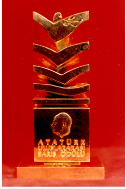
Atatürk Uluslararası Barış Ödülü