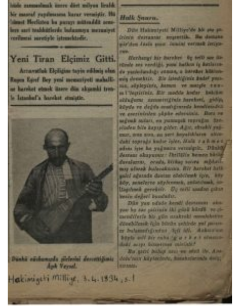
Âşık Veysel'in 3 Nisan 1934 günü Hâkimiyet-i Milliye gazetesinde yayımlanan fotoğrafı.

1965'te Âşık Veysel: "Ana dilimize ve milli birliğimize yaptığı hizmetlerden ötürü, yaşadığı sürece vatanî hizmet