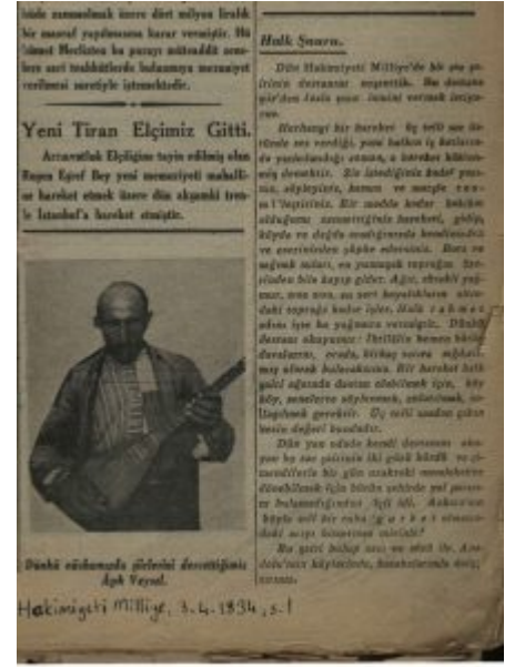
Âşık Veysel'in 3 Nisan 1934 günü Hâkimiyet-i Milliye gazetesinde yayımlanan fotoğrafı.

1965'te Âşık Veysel: "Ana dilimize ve milli birliğimize yaptığı hizmetlerden ötürü, yaşadığı sürece vatanî hizmet