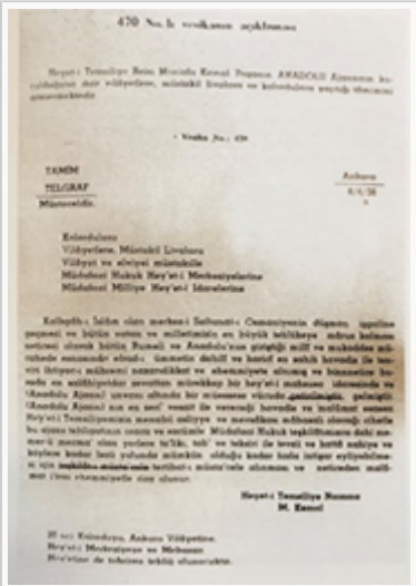
Ajansın kurulduğunu bildiren telgraf (Transkripsiyon)

Kuruluş kararının verildiği toplantıda Ajansın önemli bir misyon üstleneceği kararlaştırılmıştır. Hazırlanacak bültenlerle sadece millî hareket ile ilgili gelişmeleri değil, dış kamuoyu ve basınla ilgili bilgiler alınarak haber bültenleri aracılığı ile hedef kitleye ulaştırılması da amaçlanmaktadır. Bu dönemde böyle bir ajansa büyük ihtiyaç duyulması sebebiyle Mustafa Kemal ajans kurulması fikrini hemen benimsemiş ve en kısa sürede, en seri araçla kuruluş haberini duyurmuştur.