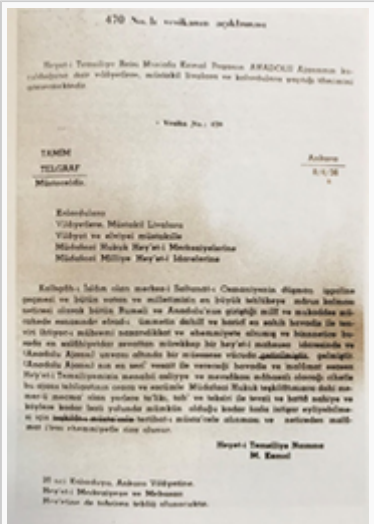
Ajansın kurulduğunu bildiren telgraf (Transkripsiyon)

Kuruluş kararının verildiği toplantıda Ajansın önemli bir misyon üstleneceği kararlaştırılmıştır. Hazırlanacak bültenlerle sadece millî hareket ile ilgili gelişmeleri değil, dış kamuoyu ve basınla ilgili bilgiler alınarak haber bültenleri aracılığı ile hedef kitleye ulaştırılması da amaçlanmaktadır. Bu dönemde böyle bir ajansa büyük ihtiyaç duyulması sebebiyle Mustafa Kemal ajans kurulması fikrini hemen benimsemiş ve en kısa sürede, en seri araçla kuruluş haberini duyurmuştur.