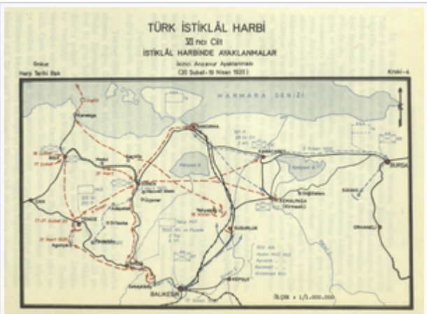
Anzavur İsyanı Kroki - 4 (s. 80)

KROKİLER (Türk İstiklâl Harbi: İstiklâl Harbinde Ayaklanmalar (1919-1921)) , C 4, Genelkurmay Basımevi, Ankara, 1974.)