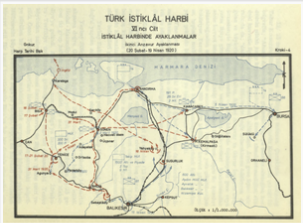
Anzavur İsyanı Kroki - 4 (s. 80)

KROKİLER (Türk İstiklâl Harbi: İstiklâl Harbinde Ayaklanmalar (1919-1921)) , C 4, Genelkurmay Basımevi, Ankara, 1974.)