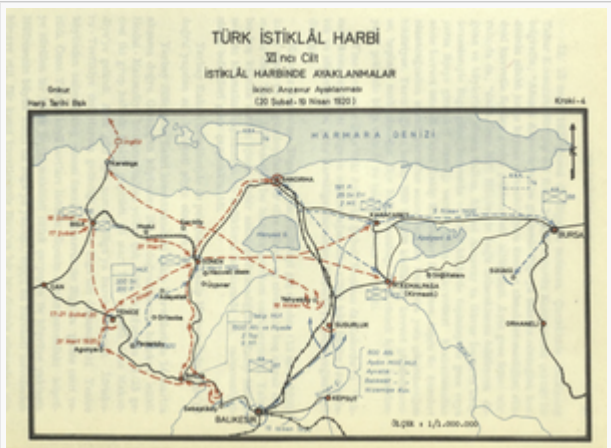
Anzavur İsyanı Kroki - 4 (s. 80)

KROKİLER (Türk İstiklâl Harbi: İstiklâl Harbinde Ayaklanmalar (1919-1921)) , C 4, Genelkurmay Basımevi, Ankara, 1974.)