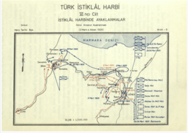
Anzavur İsyanı Kroki - 5 (s. 86)