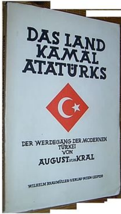
DAS LAND KAMAL ATATÜRKS