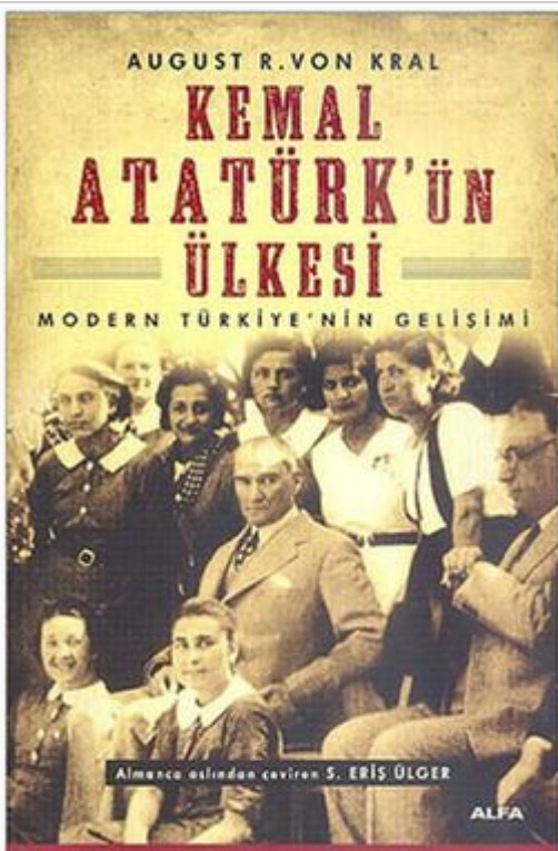
KEMAL ATATÜRK'ÜN ÜLKESİ